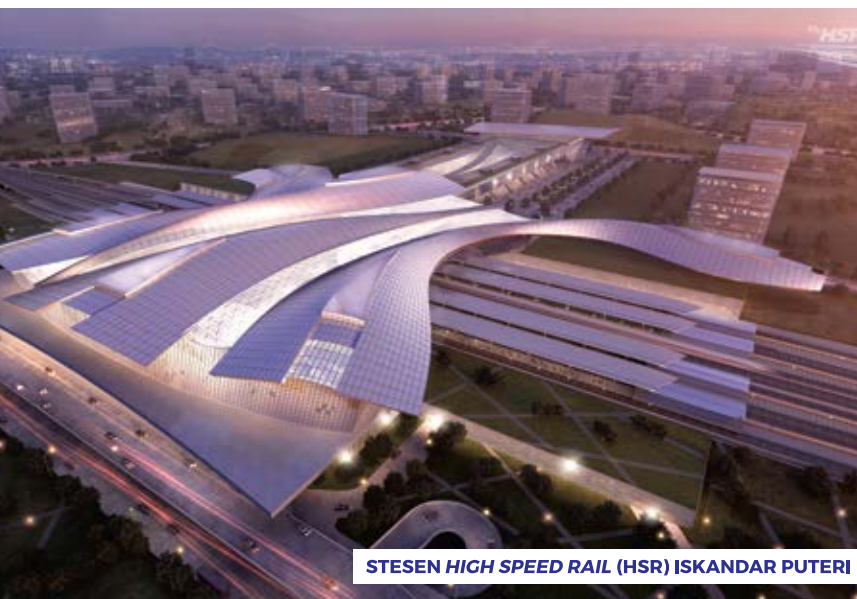
STESEN HIGH SPEED RAIL (HSR) ISKANDAR PUTERI