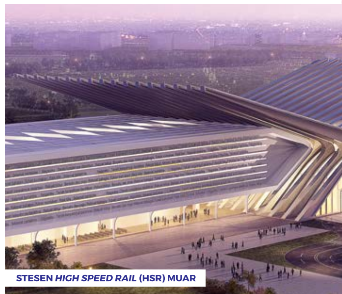
STESEN HIGH SPEED RAIL (HSR) MUAR