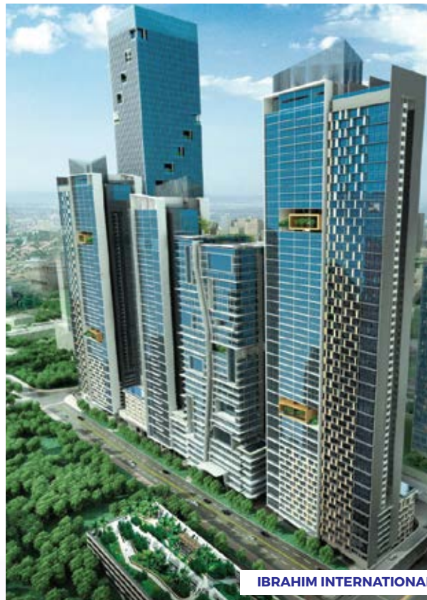
IBRAHIM INTERNATIONAL BUSINESS DISTRICT (IIBD)

Misi ini akan menjadi dorongan baharu untuk merealisasikan visi besar Johor Yang Berkemajuan.